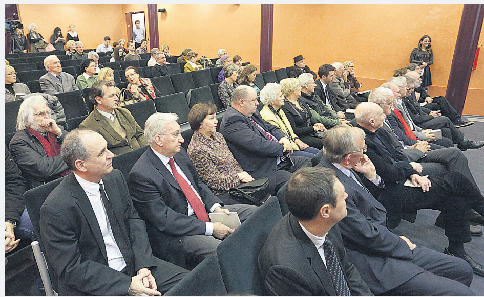
Matičina dvorana bila je ispunjena usprkos lošem vremenu

Kao što središnjicu Matice želimo vidjeti